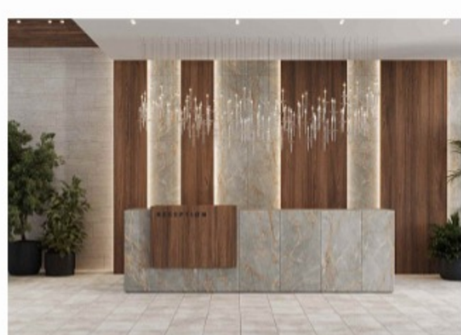
Отражение природной красоты