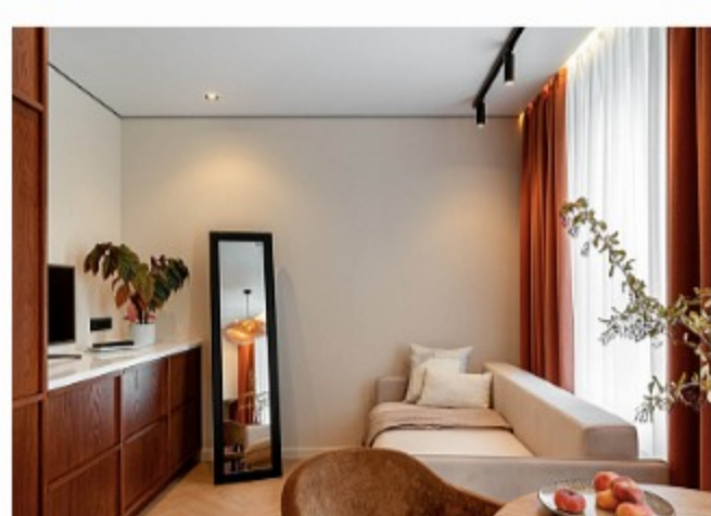
С акцентом на терракоту