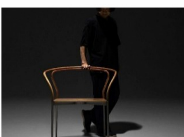
Чжу Сюэцзе в Москве