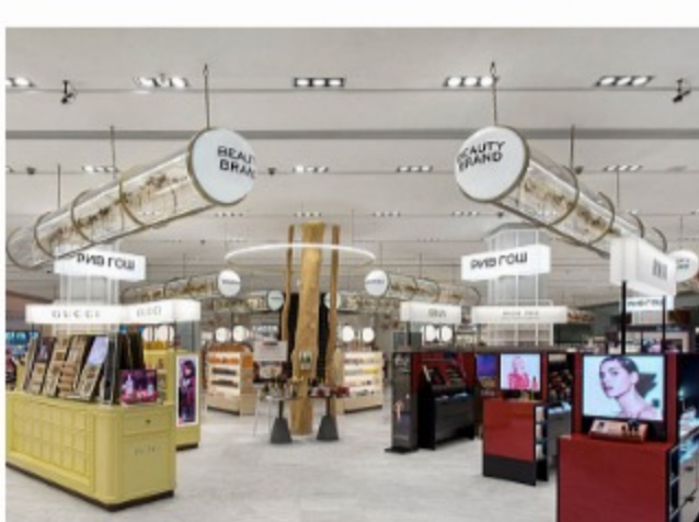
Реновация Рив Гош в «Цветном»