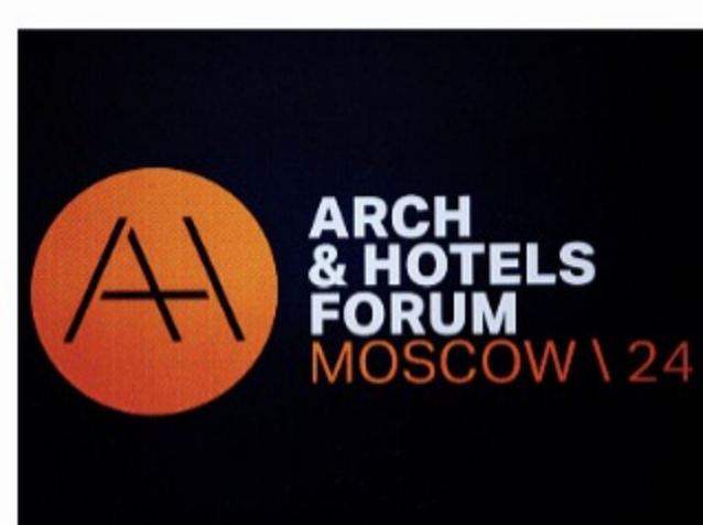
Стильный дизайн – успешный отель