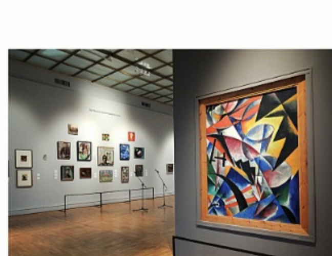
Частные коллекции современного искусства