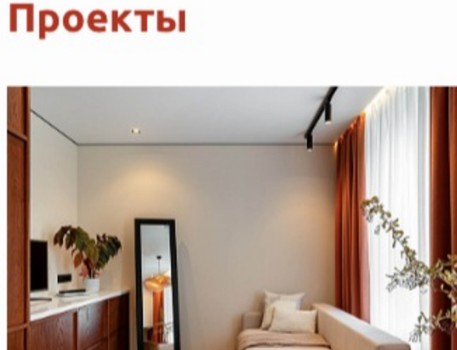
С акцентом на терраццо