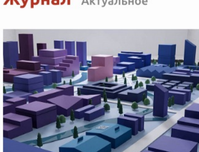
Школа дизайна НИУ ВШЭ на АРХ МОСКВЕ