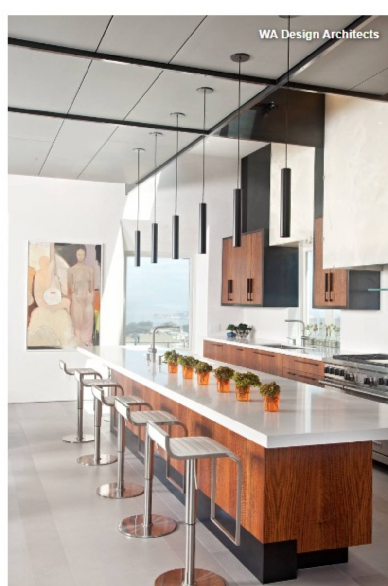
WA Design Architects

Любые глянцевые краски хорошо работают в очень маленьких помещениях, причем очень локально, всего на одну стену, которую вы назначаете акцентной. Или же в помещениях площадью не больше пары-тройки квадратных метров. Цвет в этом случае можно использовать практически любой, можно сделать даже черные потолки в глянце, но обязательно дозированно. Иначе очень легко свалиться в пошлость.